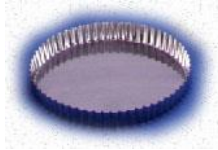
Fotoğraf 1.3: Tart ve pay kalıbı