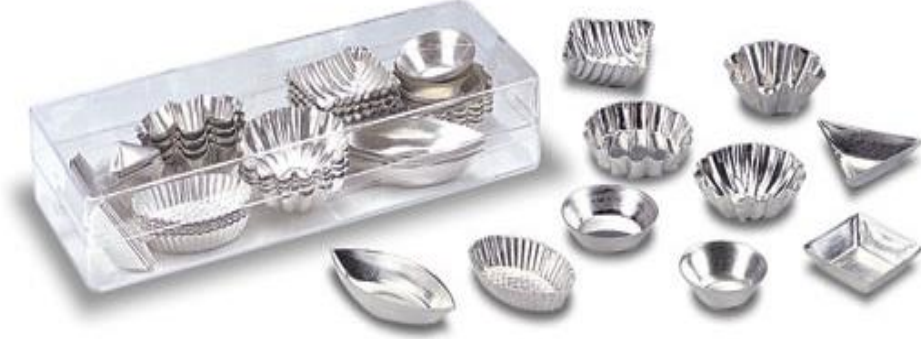
Fotoğraf 1.7: Çeşitli büyüklük ve formlarda tartölet ve pötifür kalıpları